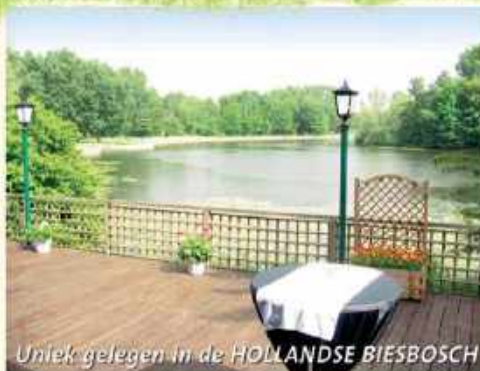
Uniek gelegen in de HOLLANDSE BIESBOSCH

Direct naast ons restaurant bevindt zich EEN GROTE SPEELTUIN.