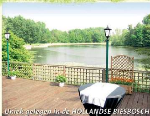
Uniek gelegen in de HOLLANDSE BIESBOSCH

Direct naast ons restaurant bevindt zich EEN GROTE SPEELTUIN.