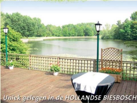
Uniek gelegen in de HOLLANDSE BIESBOSCH