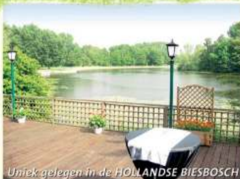
Uniek gelegen in de HOLLANDE BIESBOSCH