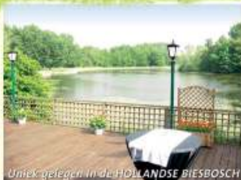
Uniek gelegen in de HOLLANDE BIESBOSCH